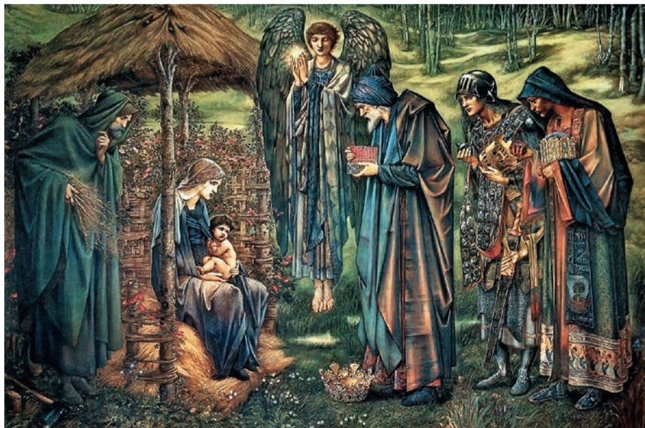
Едвард Берн-Джонс (1833-1898), «Вифлеємська зірка», Музей і картинна галерея м. Бірмінгем, Великобританія

Це ніч слави, тієї слави, яку проголошували ангели у Вифлеємі, і яку ми проголошуємо по всьому світі.