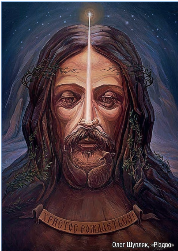
Олег Шупляк, «Різдво»

Спаситель прийшов на світ на те, щоб примирити людину з Богом, сотворіння з його Творцем, та помирити людину з людиною. Прийшов до своїх, а свої його не прийняли. Бог сповнив свою обітницю. Єдинородний Божий Син справді прийшов на світ, і Його народження стало центральною подією всієї історії людства, надаючи світові новий напрям, зворотну дорогу до Бога та до своєї надприродної мети – вічного життя в Царстві Божому. Спаситель приніс з неба людям