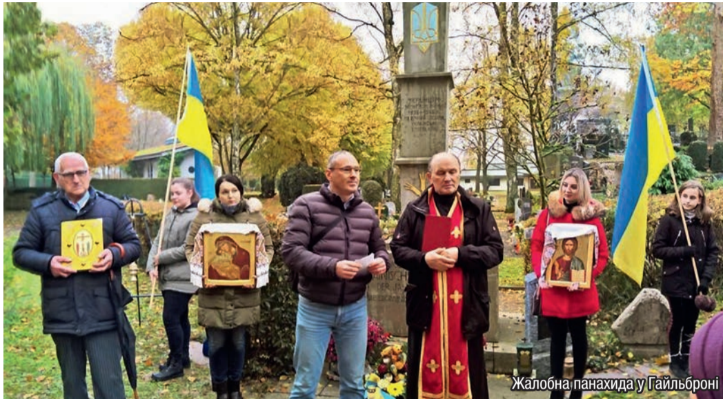
Жалобна панахида у Гайльброні

Уже традицією стало для Української громади Гайльбронну вшанування пам'яті українців, котрі загинули у Другій Світовій війні 1939–1945 років за межами своєї Батьківщини. В черговий раз громада зібралася біля Пам'ятника українцям – жертвам війни у День Жалоби, цього разу 17 листопада 2019 року, що є днем вшанування пам'яті жертв війни, терору, тиранії та диктатури.