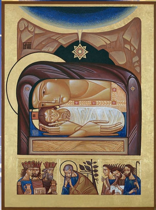
Люба Яцків, «Різдво Христа»