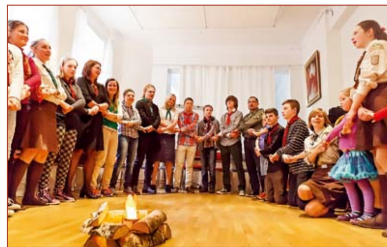
«Коло на добраніч»

Також 11 травня у Стокгольмі відбулись сходи, на яких юні пластуни вітали в честь Дня Матері своїх найрідніших людей. Віршами та сердечними піснями було розчулено не одне материнське серце. Виховники,