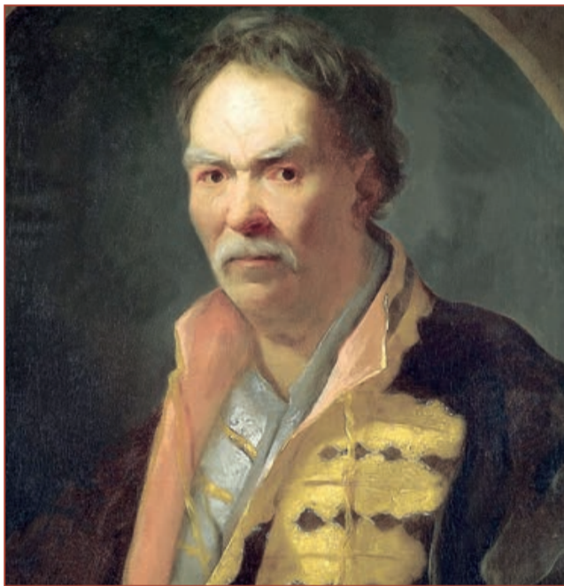
У казематі петропавлівської фортеці гетьман Павло Полуботок помер 29 грудня 1724 року. А через місяць пішов з життя і той, що «розпинав Україну» – російський цар Пйотр I. Робота Івана Нікітіна.

По свіжій пам'яті автор «Історії Русів» писав: «Премногих старших і значних козаків, котрі були запідозрені в прихильності до Мазепи, тому що не прибули на військову раду для вибору нового гетьмана, вишукували по домах і віддавали на різні езекуції в містечку Лебедині біля Охтирки. Ці езекуції були звичайно Меншиковського ремесла: колесувати, четвертувати і на паль вбивати, а вже що найлегше за іграшку вважали – вішати і голови рубати.