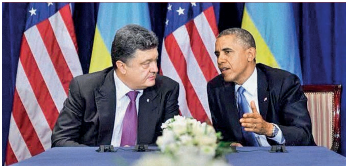
04.05.2014. Обраний президент України Петро Порошенко зустрівся у Варшаві з Бараком Обамою. Цей, зокрема, сказав: «Дні імперії закінчилися. Більші нації не можуть притискати менші. Ми не приймемо окупацію Росією Криму. Наші вільні нації єдині в тому, що подальші провокації з боку Росії лише означатимуть її подальшу ізоляцію».

Перелік реформ, що їх слід провести якнайшвидше, є майже невичерпним: Україна потребує комплексного преображення. Проте є одна справа, яка потребуватиме невідкладного втручання, оскільки без її вирішення корозія роз'їдатиме усі без винятку наші суспільні проекти. Йдеться, звичайно, про по-