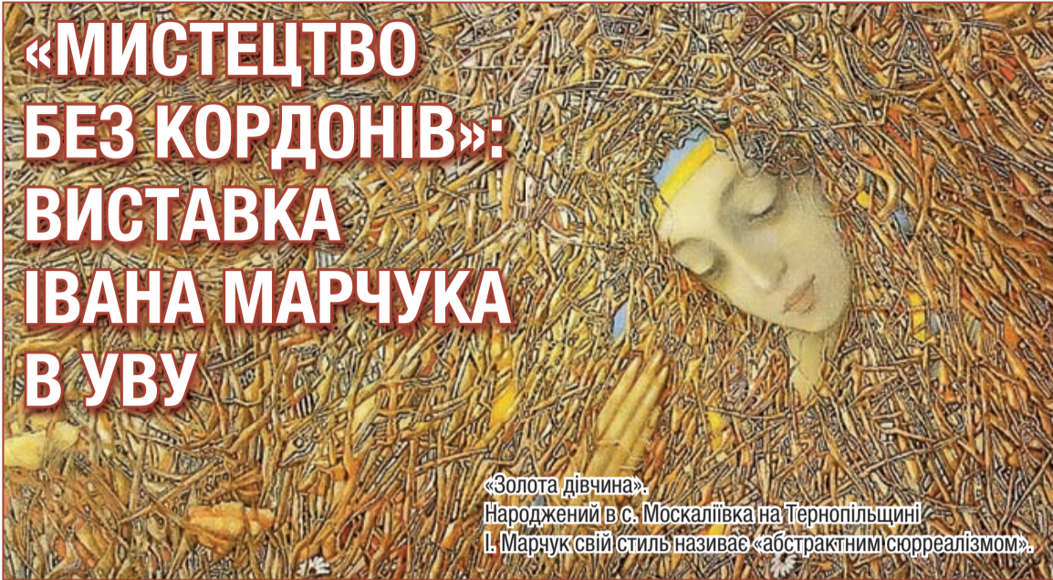
«Золота дівчина». Народжений в с. Москалівка на Тернопільщині І. Марчук свій стиль називає «абстрактним сюрреалізмом».

23 травня 2014 року в приміщенні Українського Вільного Університету відбулося відкриття виставки Івана Марчука – видатного українського художника, лауреата Національної Премії України ім. Тараса Шевченка, єдиного українського митця, прийнятого до Золотої Гільдії Римської Академії Сучасного Мистецтва. У 2007 році за рейтингом британської газети «The Daily Telegraph» художник увійшов до числа 100 найвизначніших геніїв сучасності. Іван Марчук створив власний світ художніх образів у високо індивідуальній манері. Його неповторна манера письма, технічна і композиційна довершеність, стилістична різноплановість робіт викликають захоплення.