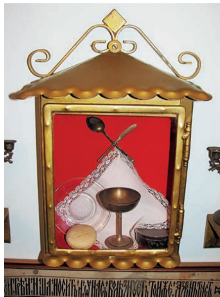
Музей Патріарха Йосифа Сліпого в Римі, УКУ. Чаша, дискос (тарілочка), копіє (ножик), ложечка, – речі, які Патріарх Йосиф уживав в Сибірі. (Опис о. Є. Небесняка)

Папа Іван XXIII, унаслідок свого пасторального підходу до комунізму, оприлюднив в 1961 р. енцикліку Mater et Magistra («Мати й Вчителька»), а 1963 р. Pacem in terra («Мир на землі»), якими він, практично, зняв кару-вилучення з Церкви для тих католиків, які бажали співпрацювати з комуністами й провадити з ними діалог. За словами Папи Івана XXIII: «Можливо, що коли учора наближення до комуністів, або діалог з ними, вважалися незручними й неплідними, сьогодні, чи може завтра, вони зможуть стати вигідними й плідними!».