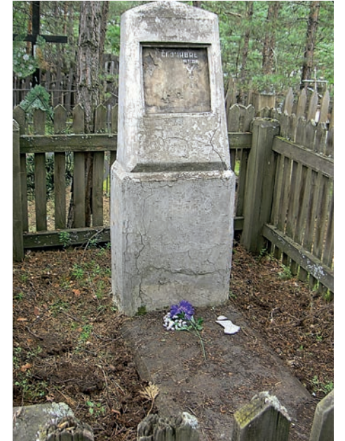
Могила блаженного Петра Вергуна в с. Ангарське, половина 2000 рр.

Преосвященний владика Юліан Гбур, Єпарх Стрийський, з метою