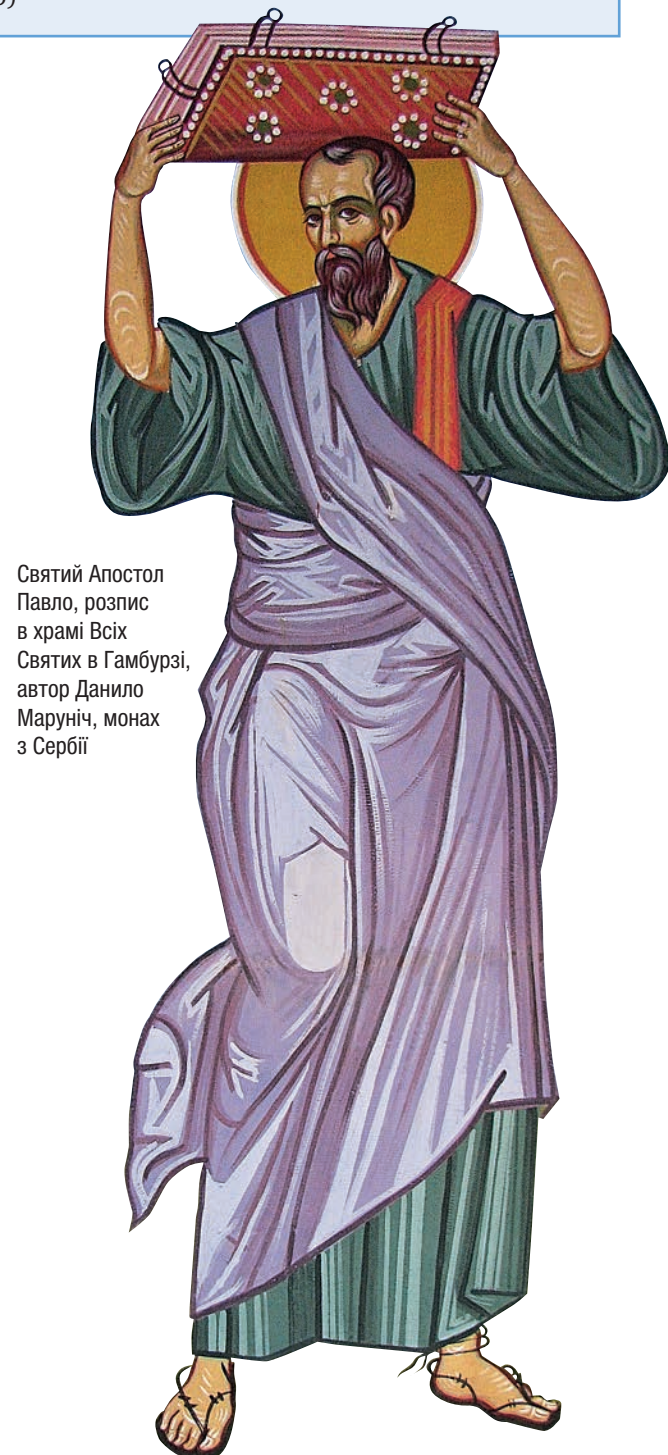
Святий Апостол Павло, розпис в храмі Всіх Святих в Гамбурзі, автор Данило Маруніч, монах з Сербії