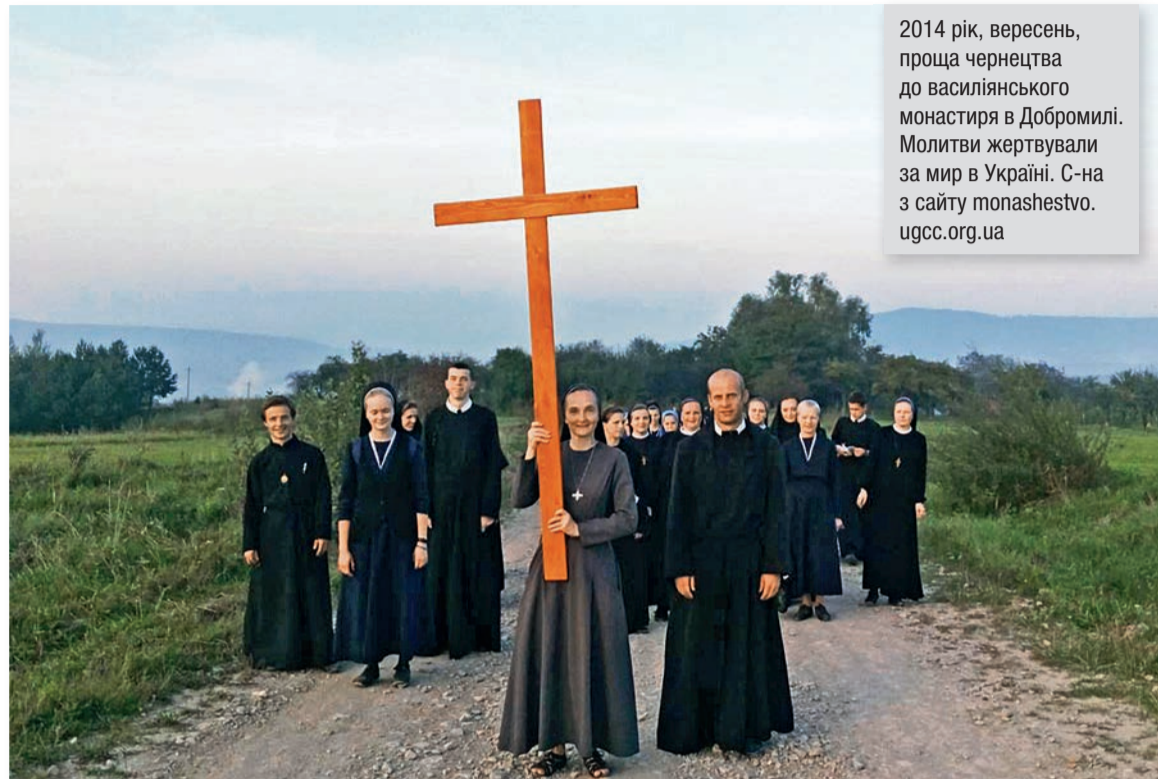
2014 рік, вересень, проща чернецтва до василіянського монастиря в Добромилі. Молитви жертвували за мир в Україні.

Східне чернецтво, в своїх зовнішніх формах, було впливом утечі перших християнських ідеалістів від поганської суспільності римської імперії, щоб здійснювати на самоті євангельське вчення й ідеали. Християни, які були поклали Євангелію в основу життєвих вартостей, не бачили для себе можливості реалізувати християнські євангельські ідеали серед тодішньої поганської суспільності. Тому вони шу-