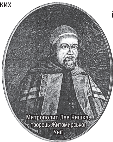
Митрополит Лев Кишка – творець Житомирської Унії

Радомишль – колишня резиденція греко-католицьких митрополитів. Відомо, що саме цим теперішнім районним центром Житомирщини 1729 року володів митрополит Атанасій Шептицький, предок митрополита Андрея Шептицького. Децю пізніше, у 1746 році, він влаштував у місті резиденцію унійних митрополитів.