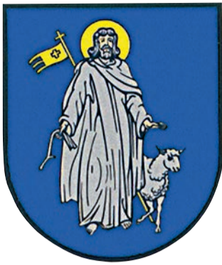
Помор'яни, селище міського типу Золочівського р-ну Львівської обл.; герб із зображенням св. Івана Хрестителя з Божим ягням біля ніг