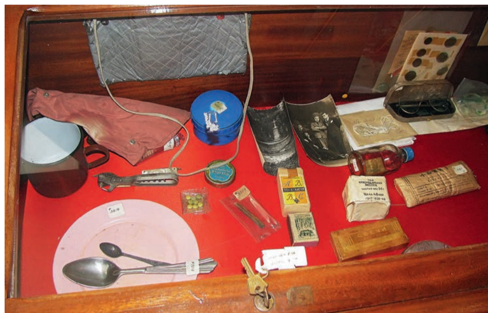
Музей Йосифа Сліпого в Римі, УКР. Предмети щоденного вжитку, які були з Патріархом в таборах Сибіру і Мордовії

Патріарх своїми заявами, своєю самою присутністю, не одному єпископові на Соборі, не одному членові богослужбових згромаджень та не одному мирянину засвідчив, що за «залізною завісою» безбожна комуністична влада нищить храми, закриває, а то й перебудовує їх на танцювальні салони, кінозали, склади, посилає вірян на Сибір за віру! Захід, чесно кажучи, не був ознайомлений з реаліями в Радянському Союзі.