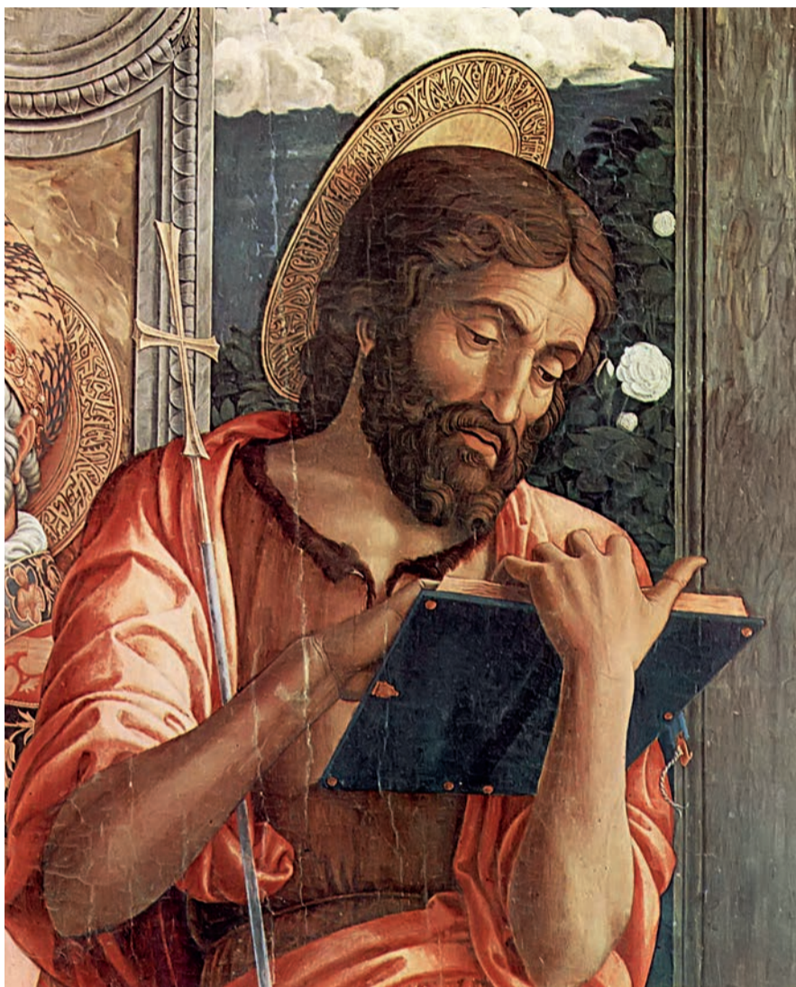
Андреа Мантенья, 1459 р., «Іван Хреститель»

Можемо із певністю сказати, що із земських осіб Нового заповіту після Ісуса Христа було дві інші знаменні особи – Діва Марія та Іван Хреститель. Це також показано в нашій іконографії. Зауважмо, що у церковному календарі, крім Різдва Господнього, відзначають лише два інші дні народження – Богородиці та Івана Предтечі. Та якщо уважно подивимося в церковний календар, то побачимо, що Іван Хреститель – єдиний серед усіх святих, кому Церква присвятила аж шість празників на рік. А дехто ще згадує за літургичним приписом кожного вівторка. Найурочистішим серед усіх свят на його честь є Різдво. Чому так? Якщо люди визнають святом одного із людей, то цим самим ставлять