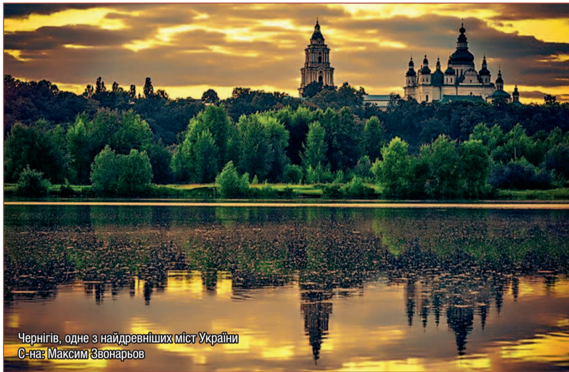
Чернігів, одне з найдревніших міст України

Рік 1067-ий, з його зовнішніми політичними і мілітарними неуспіхами та внутрішньо-політичними ускладненнями захитав рівновагою Київської Держави Ізяслава. Невдачі начальної державної влади розкрили і показали публічно розходження серед Ярославичів і в інших – політичних й не політичних справах.