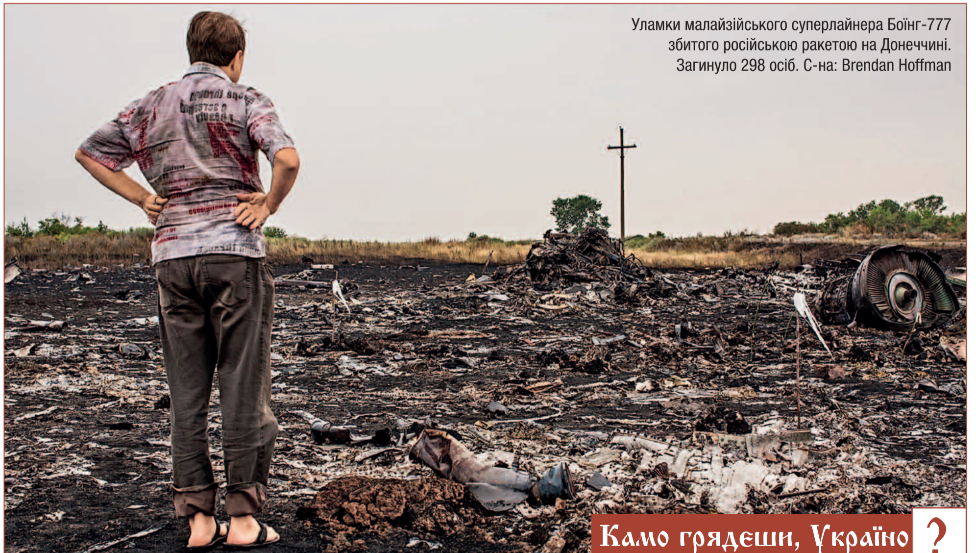
Уламки малайзійського суперлайнера Боїнг-777 збитого російською ракетою на Донеччині. Загибло 298 осіб.