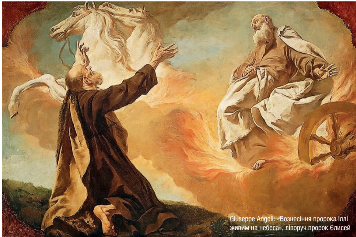
Giuseppe Angeli: «Вознесіння пророка Іллі живим на небеса», ліворуч пророк Елісей

Святий пророк Ілля – один з найбільших пророків і перший незайманий дівственник Старого Завіту. Народився в Фесвії Галаадській в коліні Левіїному за 900 років до Втілення Бога Слова. Дане немовляті ім'я Ілля (фортеця Господня) визначило все