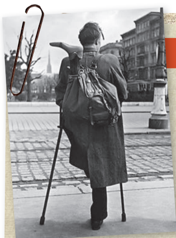
Ernst Haas, «Військовополонений повертається додому», Відень, 1946 р.

замкнених реколекцій, щоденного св. Причастя і солідного католицького свідомлення. На зовні католицизм виявляв себе як пробоева сила, що вийшла з дефензиви XIX століття на арену, де кипіло життя і вже в житті громадському, національному, а навіть міжнародному почала