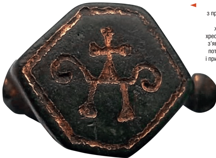
Перстень великокняжої доби з проквітлим хрестом. Такий хрест виступає прообразом Дерева життя. «Проквітлий (пророслий) хрест, орнаментований рослинами, з'являється в IV ст. В Русь-Україну потрапив з Візантії безпосередньо і при посередництві Криму в період після офіційного прийняття християнства.» (І. Ровенчак, «Вісник геодезії та картографії»)

І невдовзі вона прибула до Корсуня з величавим двором. Володимир тяжко занедужав на очі, але та хвороба відступила зразу ж після хрещення. У церкві святого апостола Якова, перед цим навчений правд Христової віри, Володимир прийняв хрещення з рук Корсунського єпископа, і водночас нове ім'я – Василій. Сталося це 988 р. Разом з ним охрестилося дуже багато воїнів з його дружини. Після хрещення Володимир-Василій повинчався з Анною, у пам'ять цієї важливої події він наказав побудувати в Корсуні церкву святого Василія, повернув імператорам здобуту землю, взяв зі собою мощі святого папи Климента і його учня святого Фива (які добули з морської глибини святі Кирило і Методій), узяв багатьох священників і митрополита Михаїла, а крім того ще церковної утварі, святих книг, та вернувся на Русь.