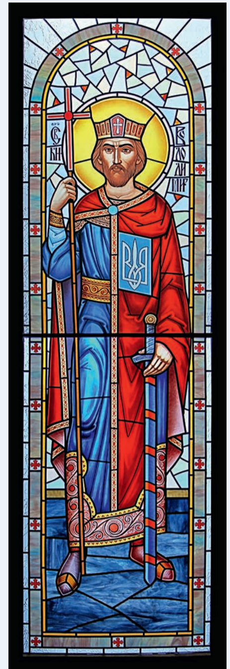
Вітраж в церкві в Дрогобичі.

Іван Луцик, фрагмент книги «Життя святих», в-во Свічадо, 2011 р.