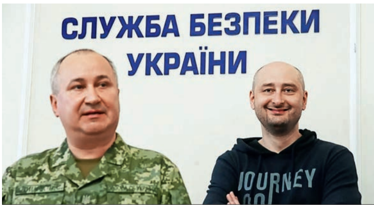
Голова Служби безпеки України Василь Грицак та журналіст Аркадій Бабченко під час зустрічі з пресою. Київ, 30.05.2018 р.