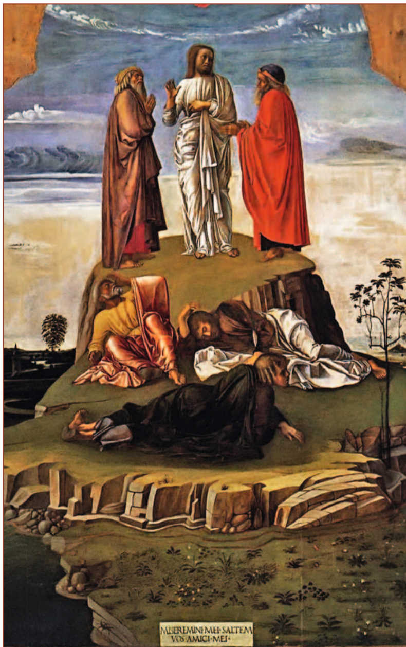
Преображення Господнє на горі Тавор, робота Джованні Белліні, 1455 р.

перед очі велику подію, що сталася на горі Тавор з Ісусом Христом, який взяв зі собою трьох учнів. Не потрібно було брати усіх, вистарчало трьох свідків, щоб пізніше це стало явним та проголошеним. Святий Іван євангеліст, свідок цього, чомусь не описав цієї події у своїх євангельських розповідях. Коли Спаситель цього разу вийшов на гору, апостоли побачили дивну зміну, що відбулася не тільки на обличчі Ісуса, яке «засяло наче сонце»: його одежа світилася неймовірним світлом. Не від хімічних елементів вона заблищала й побіліла, але від величності сили Божества і то тільки, як прояв до певної міри. У Господі події стаються по-іншому як у людей. Люди обмежені, а Він – Творець, Всевишній Бог, Володар світу та усяких змін. Апостоли побачили невидиме Божество видимим у плоті на Таворській горі осяяним й цим були дуже у страху здивовані.