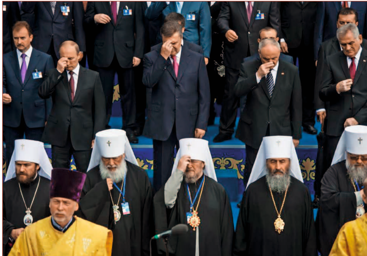
Україна. Президенти Росії – В. Путін, України – В. Янукович, Молдови – Н. Тімофті і Сербії – Т. Николич під час молитви на Володимирській Гірці в Києві, 27 липня 2013 року

Втім, концепція «молодшого брата» поширюється не тільки на історію. На життєвому рівні серед росіян популярним є стереотип, що українці, це виключно сільські жителі (в кращому випадку переїхали в місто зовсім недавно). Тобто, українець – це обов'язково такий жлоб в шароварах, який «шокає» і «ГАкає», п'є горілку і постійно їсть сало, і не здатний ні