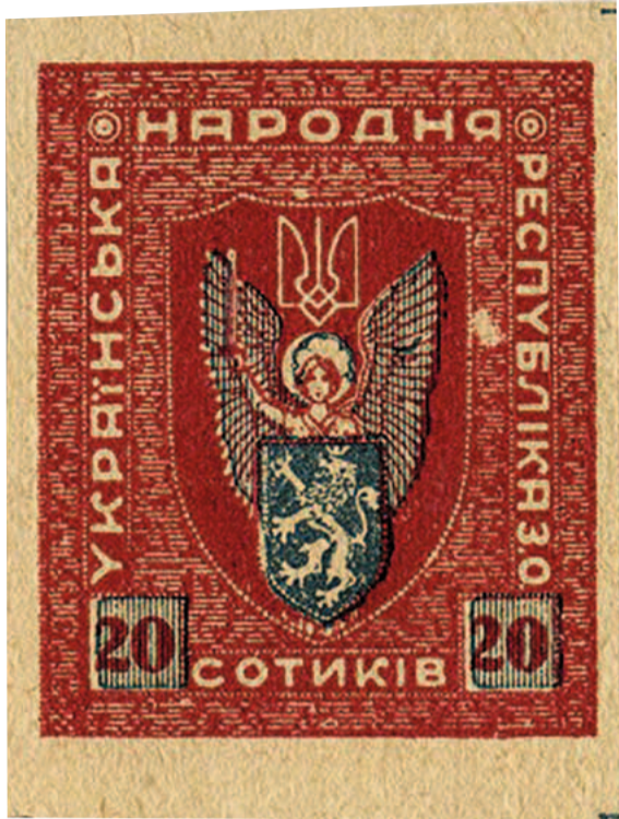
Марка УНР. Зверніть увагу на символіку гербової композиції, що відображала ідеї соборності українських земель: Архангел Михаїл, як символ Наддніпрянщини сполучений з левом, символом Галичини. Текст та світлина Ореста Круковського