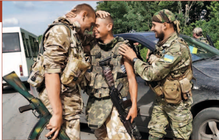
Привітання. Неочікувана зустріч друзів поблизу Слов'янська. Українські воїни, які довго себе не бачили.