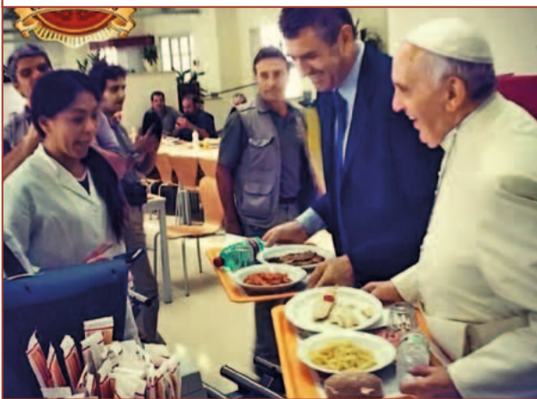
Змінювати себе важко, а традиції Ватикану, напевно, ще важче. Папа Франциск у ватиканській їдальні для працівників, 25 липня 2014 р.

«Мрію про місійний вибір, здатний все переминити, аби звичай, стилі, розклади, мова та кожна церковна структура ставали належним каналом євангелізації сучасного світу, а не засобами самозбереження. Реформу структур, що вимагає душпастирського навернення, можна розуміти лише так: зробити все для того, щоб вони ставали місійнішими, щоб звичайне душпастирство в усіх своїх інстанціях було експансивнішим та відкритішим, щоб ті, які трудяться на ниві душпастирства, приймали постійне наставлення «виходу» назовні, таким чином сприяючи позитивній відповіді всіх тих, кому Ісус пропонує свою приязнь», – пише папа Франциск у другій частині першого розділу Апостольського Напоумлення «Радість Євангелія», в якому він роздумує про необхідність «навернення душпастирства».