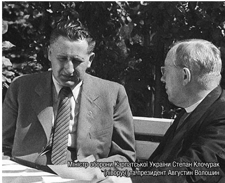
Міністр оборони Карпатської України Степан Ключурак (ліворуч) та президент Августин Волошин

Представники національного руху за підтримки членів оунівських похідних груп та вояків батальйону «На-