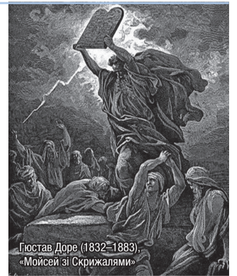
Гюстав Доре (1832–1883), «Мойсей зі Скрижалями»

Так що в біблійних словах міститься глибока істина. У них ми можемо і сьогодні побачити вказівку на зв'язок між усіма людьми, в добрі і злі, залежно від того, чи живуть люди в Божій благодаті чи позбавлені її. Це той самий закон солідарності, про який писав Іван Павло II в апостольському зверненні Reconciliatio et paenitentia : «Визнавати, що в силу людської солідарності, настільки таємничої і невловимої, наскільки реальної і конкретної, гріх кожного якимось чином відбивається на інших: це – інша сторона солідарності, яка на релігійному рівні зростає в глибокій і прекрасній таємниці спілкування святих, завдяки якому можливо говорити, що всяка душа, що підноситься, звеличує світ. Цьому закону сходження, на жаль, відповідає закон падіння, так що можна говорити і про спілкування в грісі, через яке всяка душа,