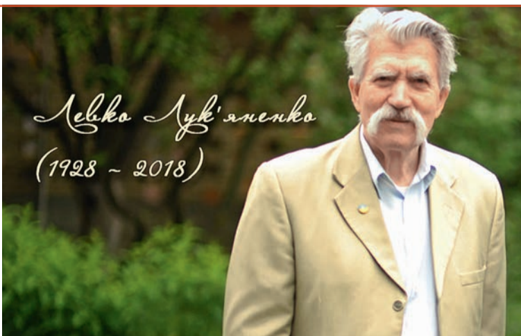
Левко Лук'яненко (1928 - 2018)

теті, досвід повоєнної окупаційної армії, в якій він служив в Австрії, досвід партійної роботи фактично як пропагандиста в райкомах у Львівській області. Це все для нього було важливим шляхом. Він дити-