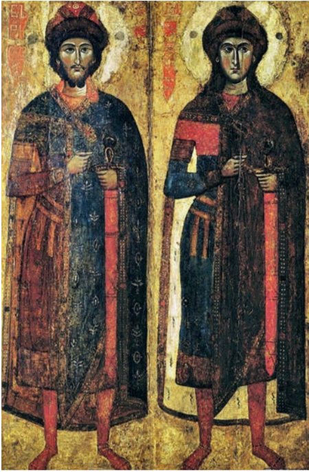
«Борис і Гліб», середина XIII ст., Київська картинна галерея

Святі благовірні князі-страстотерпці Борис і Гліб (у Хрещенні – Роман і Давид) – перші руські святі, канонізовані як Українською, так і Константинопольською Церквою. Вони були молодшими синами святого рівноапостольного князя Володимира (+15 липня 1015). Народившись незадовго до Хрещення Русі, святі брати були виховані в християнському благочестті. Старший з братів, Борис, отримав гарну освіту. Він любив читати Святе Письмо, твори святих отців і особливо життя святих. Під їх впливом Борис набрав гарячого бажання наслідувати подвигу угодників Божих і часто молився, щоб Господь удостоїв його такої честі.