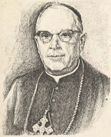
АРХИЄПІСКОП КИР ІВАН БУЧКО

У вересні 1951 року «ХГ» чимало уваги присвятив питанню української еміграції.