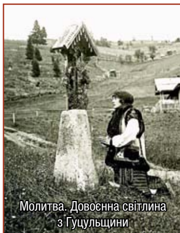
Молитва. Довоєнна світлина з Гуцульщини

(З Требника митрополита Київського Петра Могили)