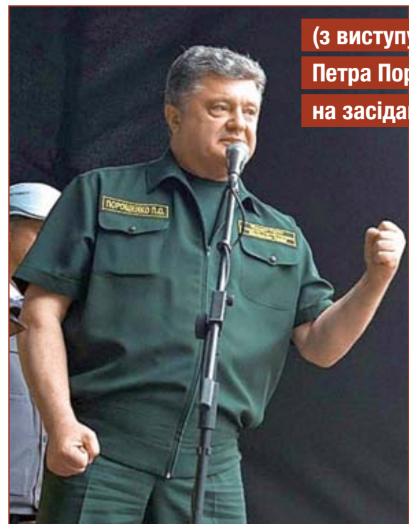
(з виступу Петра Порошенка на засіданні уряду)

Зараз йде війна за незалежність України. Не більше й не менше, за існування нашої держави, і ми нікому не здамо ані питання суверенного устрою, ані питання незалежності, ані питання територіальної цілісності. Ми залишаємося соборною й унітарною державою.