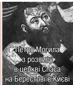
Петро Могила з розпису в церкві Спаса на Берестові в Києві

І як колись з Авраамом ти подорожував еси, вивівши його з Уру Халдейського і ворогів його Божественною силою Своєю у руки його віддав еси, так і нині, покійно молимо Тебе, рабам своїм, будучи з ними, покори ворогів наших під ноги наші. Як колись Мойсеєм єврейський рід від гіркої роботи на фараона визволив, потопивши ворогів їхніх могутньою Своєю