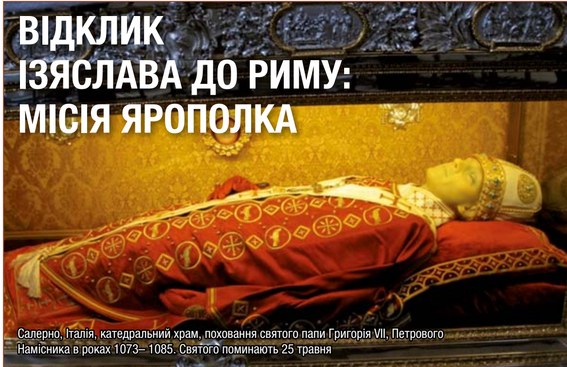
Салерно, Італія, катедральний храм, поховання святого папи Григорія VII, Петрового Намісника в роках 1073–1085. Святого поминають 25 травня

З днем 22 березня 1073 р. скінчилося в Києві друге правління Ізяслава, виконуване на основі договору з 1067 р. між старшими Ярославичами й за визначеними умовами, між якими було й настановлення нового митрополита в Києві, в єднанні з Візантією.