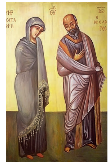
Пречиста Діва Марія та св. Йоан євангеліст, Болгарія, XIV ст. (копія)

Від Пресвятої Богородиці ми можемо вчитися живої віри в Тайну Євхаристії і надземної любові до Христа Спасителя, укритего під видами хліба і вина. Хто з набожністю, вірою і любов'ю приймає Святе Причастя, той справді подобається Божій Матері й приносить їй велику радість. Ми – немічні й грішні люди, не гідні приймати Ісуса Христа до душі. Ми маємо взивати словами пророка Ісаї: «Горе мені! Пропав я! Бо я людина з не-