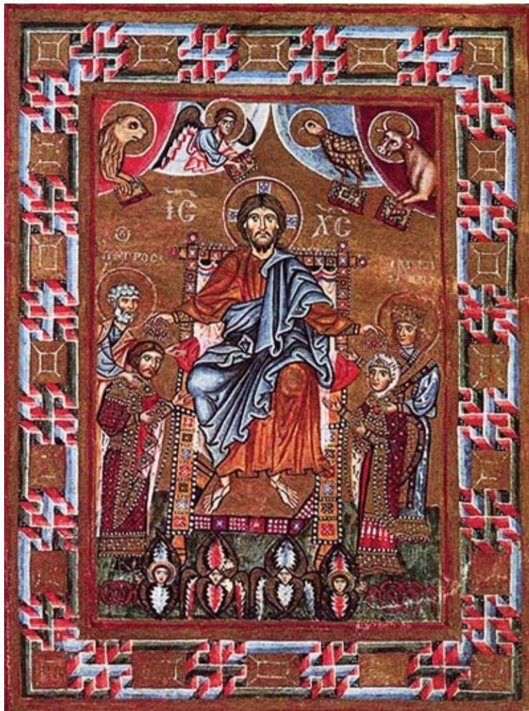
«Кодекс Гертруди», Христос коронує Гертруду і Ярополка, кінець X ст., Чівідале, Італія

4. В листі Папи до Ізяслава подано тільки найголовнішу й основну справу: повернення київського стола Ізяславові. Для поладнання інших справ було ви-