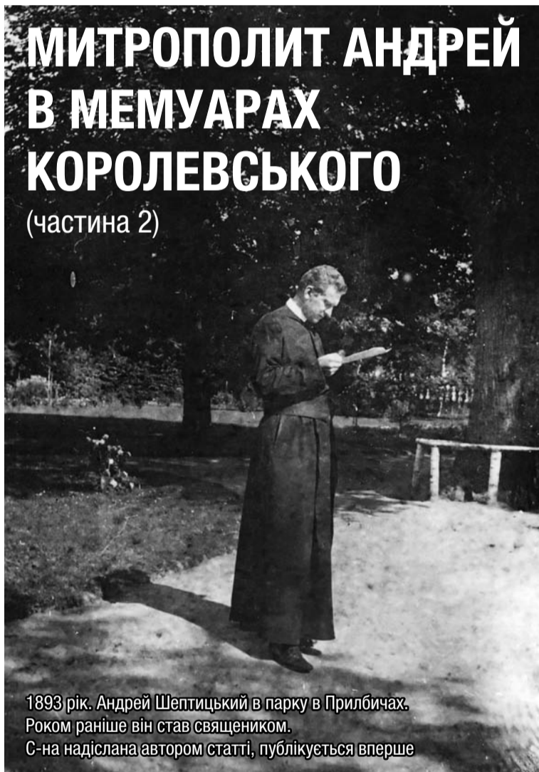
1893 рік. Андрей Шептицький в парку в Прилбичах. Роком раніше він став священником.

Отож, під час своєї останньої передвоєнної подорожі до Риму, Митрополит взяв усе, що передувало Рутському. Ці матеріали були конфісковані росіянами під час наступу на Галичину й арешту Андрія Шептицького, їх не знайдено досі.