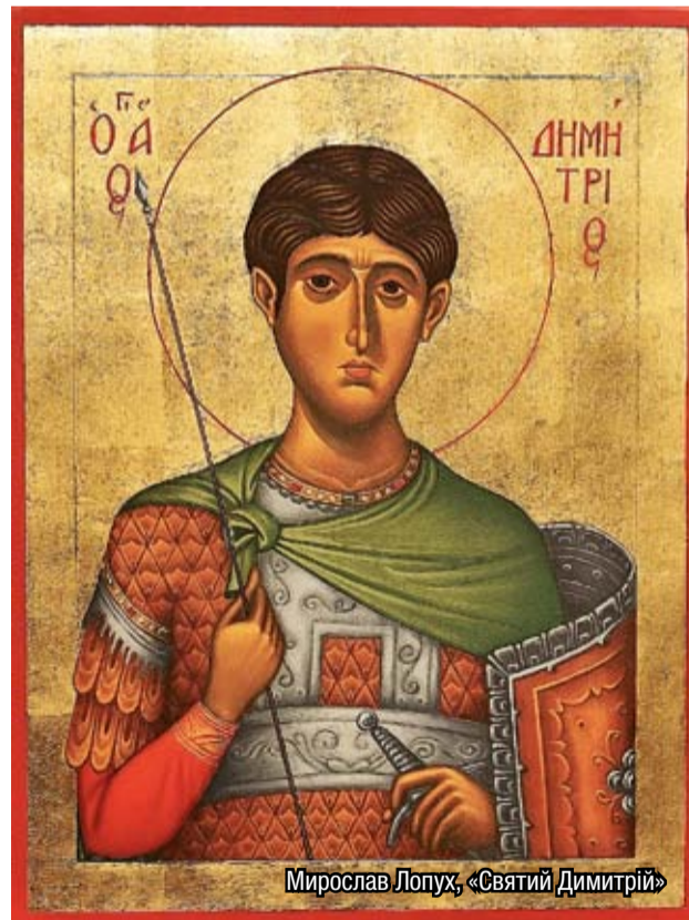
Мирослав Лопух, «Святий Димитрій»

Перший погляд на ікону відкриває золоте тло і переважаючий медовий колір зображення святого, що нагадують про тепло сонця, якого в осінні дні чекають і малі, і старші прихожани. В один із таких днів, а саме 8 листопада, за юліанським календарем припадає храмове свято, день великомученика Димитрія. В центрі ікони увагу привертає передовсім його обличчя, оточене тоненькою червоною лінією, що творить німб – символ святості. Спокійні, може дещо сумні, очі святого зразу здобувають собі прихильність глядачів, а буйне, темне волосся великомученика та брак заросту чітко вказують на його молодий вік. Натомість міцний шкіряний, ще й обложений металом панцер дуже відрізняється від крихкої постаті, яка здається не звикла ще до ходження в бойовій одежі, подібно