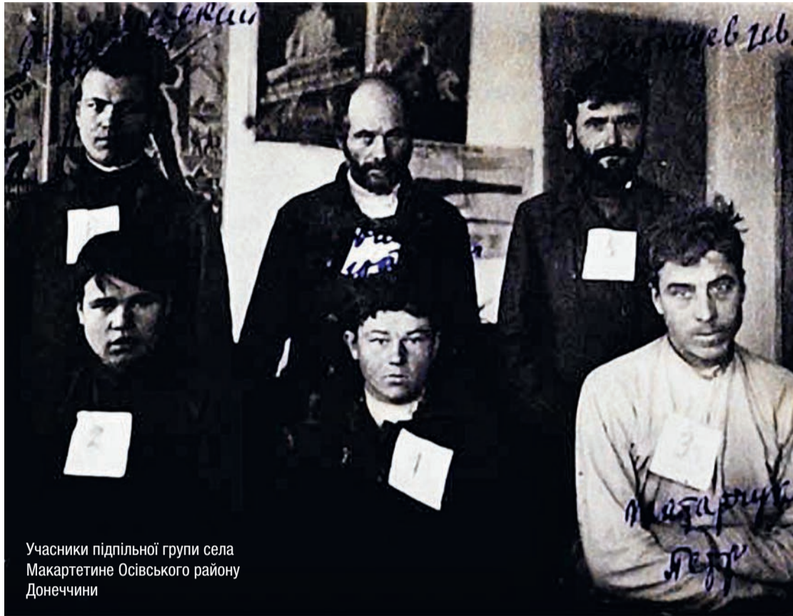
Учасники підпільної групи села Макартетине Осівського району Донецчини

Зараз ми маємо схожу ситуацію. Тому що будь-які плани, які так чи інакше виношує сучасне російське керівництво в обличчі Путіна щодо відновлення в тій чи в іншій формі російської імперії, розбива-