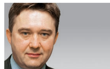
Філіп Стівенс, «The Financial Times», зреферував О.Д., «Збруч»

Дехто думає, що простий факт економічної взаємозалежності врятує ситуацію, адже в разі конфлікту програють всі сторони. Але ця динаміка може працювати в іншому напрямку. Не випадково в останньому річному звіті МВФ політичні ризики названі головною загрозою світовій економіці. Ліберальна економічна система в першу чергу залежить від світової системи безпеки.