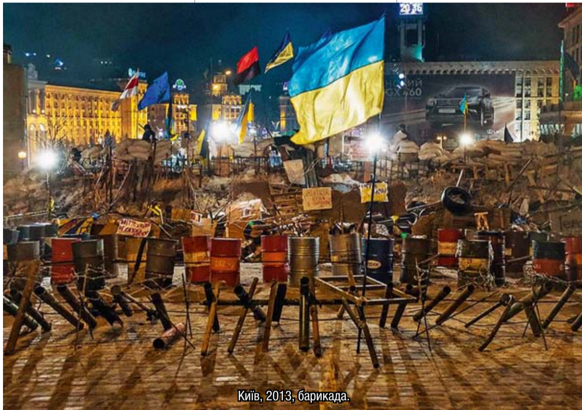
Київ, 2013, барикада.

Хай Бог благословить Україну у ці тривожні дні! (А.Ф.)