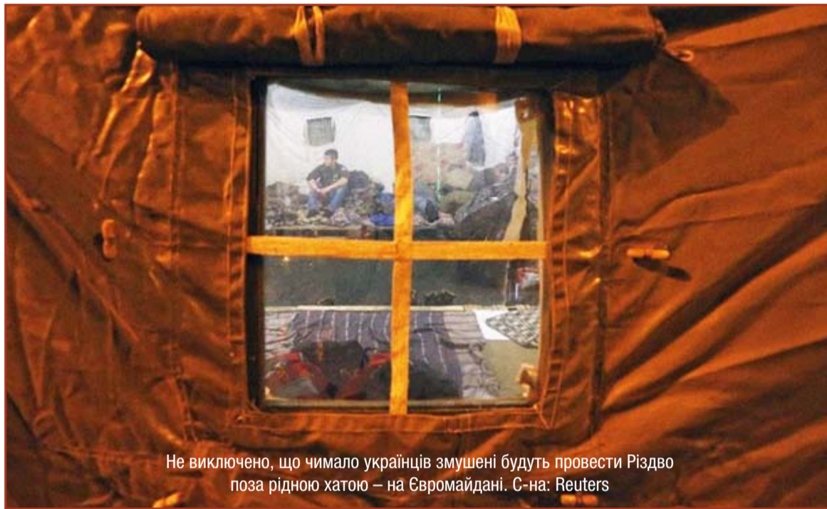
Не виключено, що чимало українців змушені будуть провести Різдво поза рідною хатою – на Євромайдані.

Кожного року у неділю перед Різдвом ми чуємо заклики священників, щоб ми приготувалися до зустрічі із Новонародженим Ісусом. І ми стараємось це зробити якнайкраще, бо самі розуміємо, що кожного гостя потрібно прийняти з найкращою пошаною.