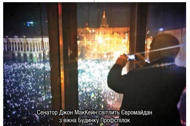
Сенатор Джон МакКейн світлить Євромайдан з вікна Будинку Профспілок

Американський сенатор Джон МакКейн прибув у Київ, щоб зустрітися з ліде-