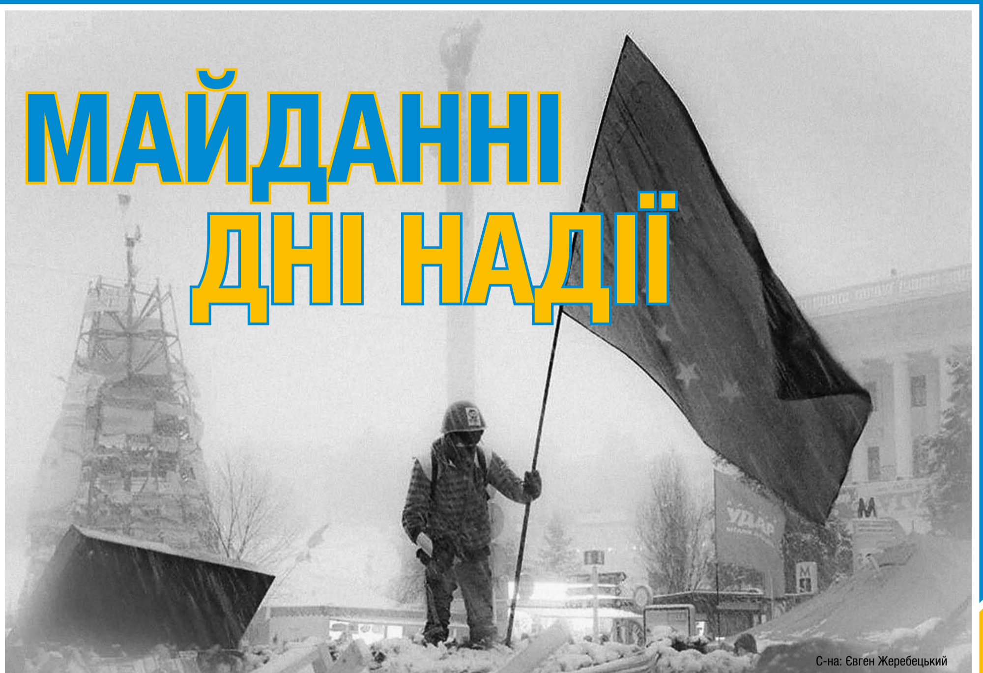
С-на: Євген Жеребецький