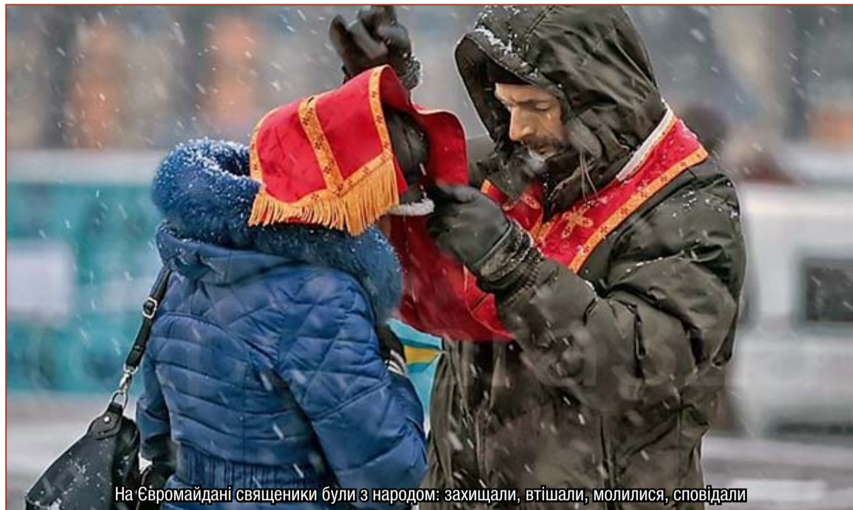
На Євромайдані священники були з народом: захищали, втішали, молилися, сповідали