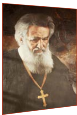
Петро Гейдек, «Митрополит Андрей», 2011 рік