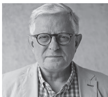
С-на: Міколай Стажиньскі, «Ньюсвік» (Польща)