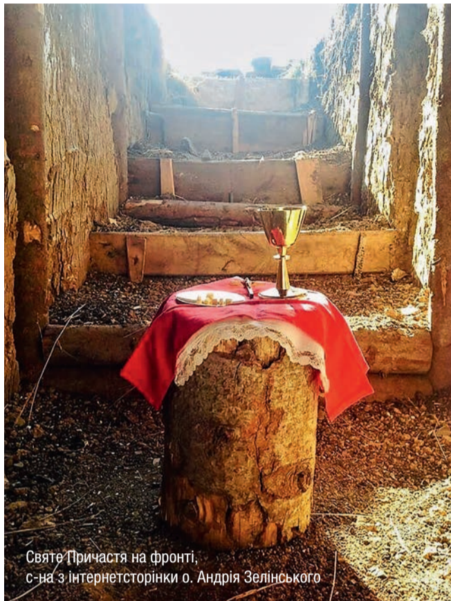
Святе Причастя на фронті

Ми свідомі того, що історія таїнства Христового вочлнення незрозуміла для людських роздумів, яку треба приймати, як Господь нам об'явив, себто вірити. Так само вірити у Божі об'явлення, як це здійснювала Мати Божя, Якій ангел Господній об'явив про непорочне зачаття, чи, як це, також робив обручник св. Йосиф, якому ангел Господній «у сні явився йому, кажучи: Йосифе, сину Давидів, не бійся прийняти Марію, жону твою, бо зроджене в ній є від Духа Святого» (Мт. 1, 20). Це не було легко прийняти Йосифові, зрозуміло. Але Йосиф і Марія повірили Божому слову, що його ім звістив ангел Божий.