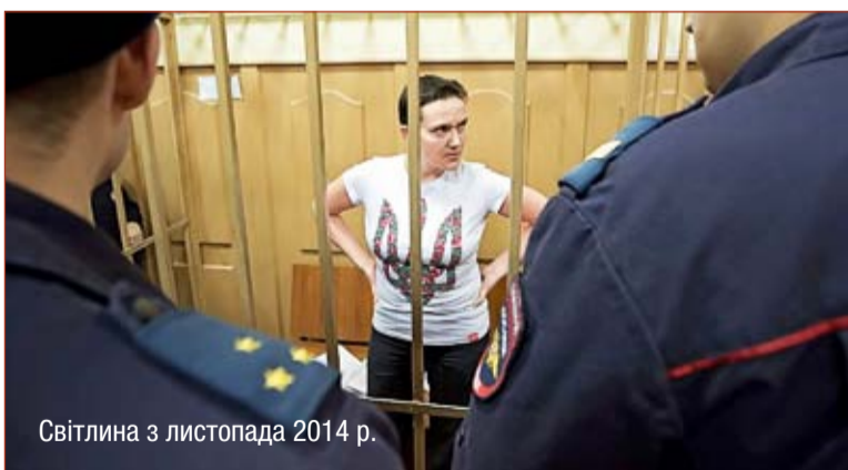
Світлина з листопада 2014 р.

Надію Савченко перевели до лікарні 29 січня через, як заявили лікарі, «різке зменшення ваги». Голодування