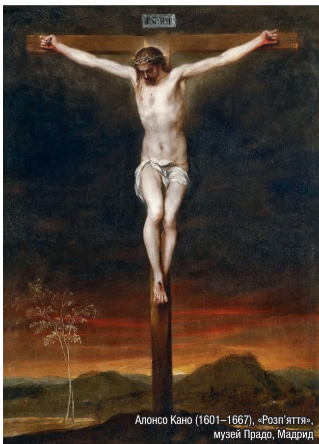
Алонсо Кано (1601–1667), «Розп'яття», музей Прадо, Мадрид

І хоч пустиня нічим не може дорівнювати родючій єгипетській землі, ізраїльський народ мусить вірити Господеві Богові і йому довіряти, здаючись цілковито на Його опіку. Але ізраїльтяни ще не закінчили складати Богові подяку за визволення з неволі, а вже беруться нарікати на Бога та на всіх його висланників. Нарікали ж вони, бо не було води, поживи й безпеки, доходючи аж до ідолопоклонства і апостазії. Тужили за Єгиптом, хоч там була неволя і всякі злидні, однак там вели вони життя звичайне й людське, а на пустині були здані на Бога. Тому ізраїльтяни воліли радше смерть у неволі, але в ситості, ніж волю, але з загрозою голодної смерті. Так пустиня виявила, ким були ізраїльтяни: тугошії, непостійного серця, малої віри до Бога