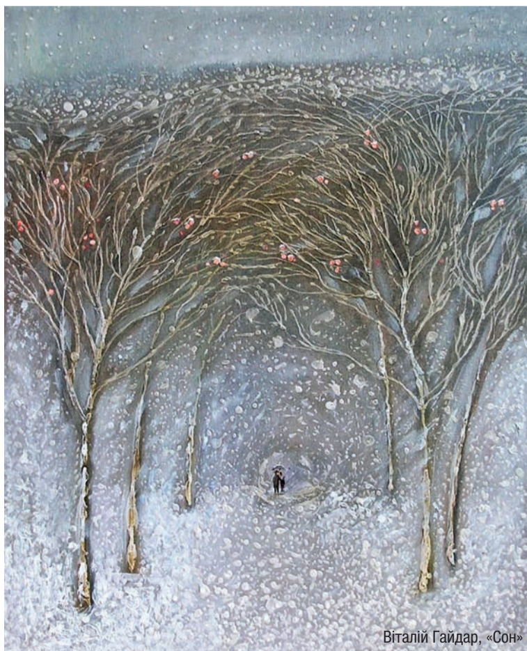
Віталій Гайдар, «Сон»

Кінець земного життя буде сюрпризом для нас, але потім нас чекатиме інша несподіванка – вічне життя. Саме тому Церква закликає призупинитись та роздумати над смертю, з якою кожен із нас у свій час зустріне. В наш час, зазначив Папа, коли люди йдуть на похорон чи на цвинтар, то там розмовляють, іноді, також їдять та п'ють, – це стає ще