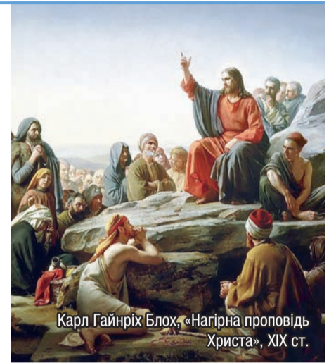
Карл Гайнріх Блох, «Нагірна проповідь Христа», XIX ст.

Підсумовуючи, Папа підкреслив, що під час Літургії Слова Бог прова-