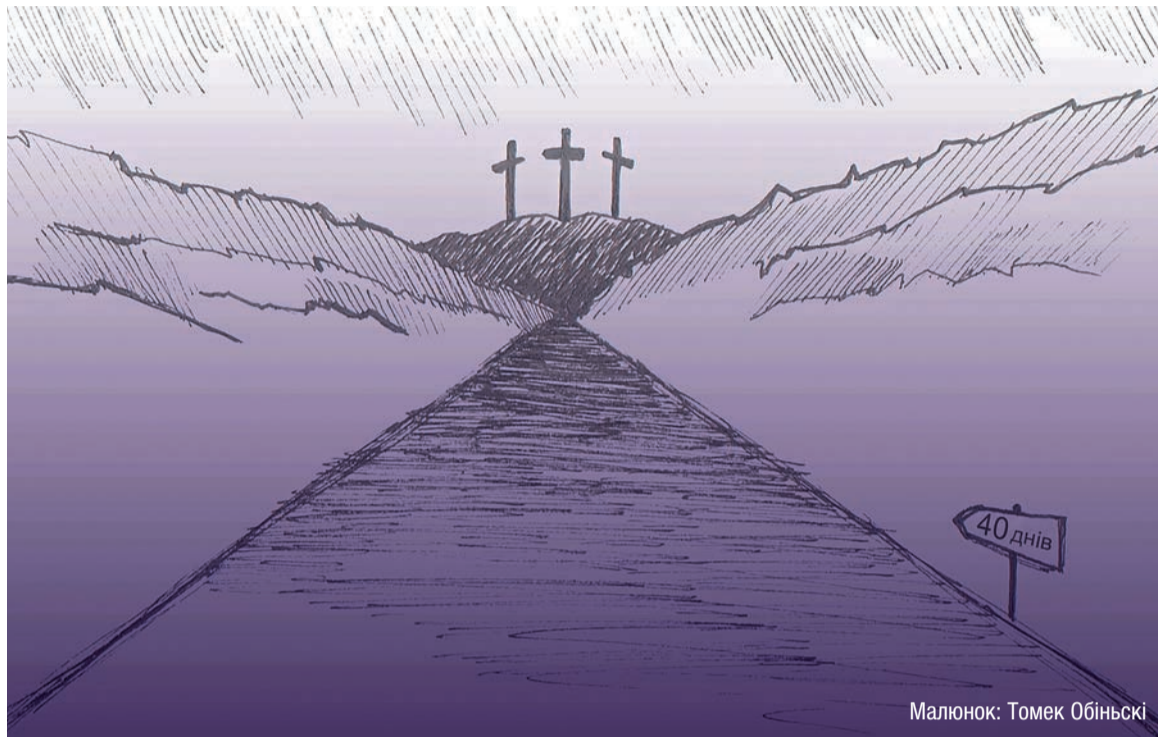
Малюнок: Томек Обінські

В початковому періоді Церква додержувала покутних практик в порядку установленому через Ісуса. Діяння Апостолів згадують про виконання обрядів, які