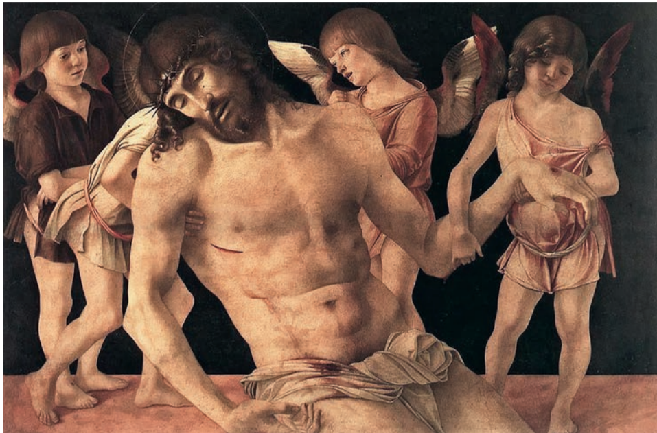
Джованні Белліні (близько 1430–1516), «Мертвий Христос підтримуваний янголами»

ший час цілого року. Як співпереживати цей день з Ісусом?