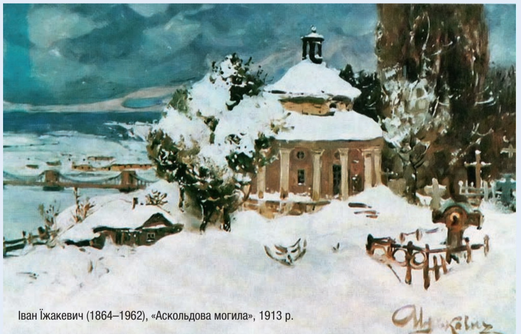
Іван Іжакевич (1864–1962), «Аскольдова могила», 1913 р.

Людмила Старицька-Черняхівська (1868–1941), фрагмент твору «Пам'яті юнаків-героїв, замордованих під Крутами»