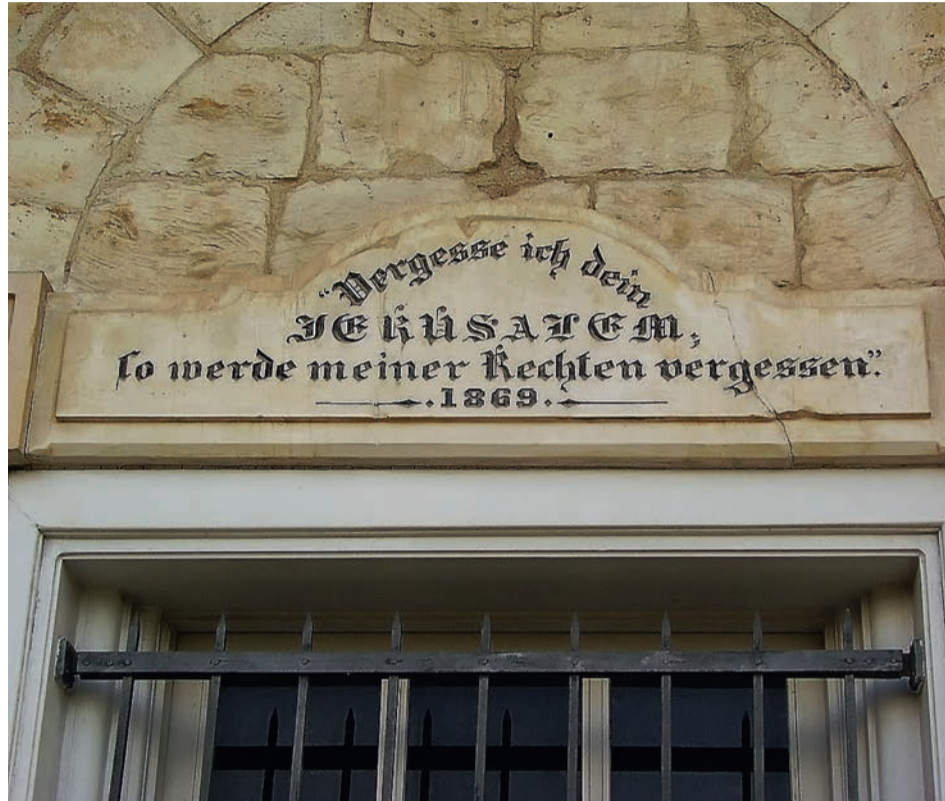
Напис на будинку Німецької колонії у Хайфі є цитатою з Книги Псалмів, в перекладі Івана Огієнка звучить так: «Якщо я забуду за тебе, о Єрусалиме, хай забуде за мене правиця моя!»

Коли в 1898-му році в Палестину з офіційним візитом прибуває кайзер Німеччини Вільгельм II, темплери, готуючись його зустріти, будують пірс. В Яффо тоді порт був дуже незручний, кораблі вставляли на якір у милі від берега і далі пасажирів пересажували на човни. Ні, для кайзера так не годиться! І будується пірс. З корабля кайзер Вільгельм II