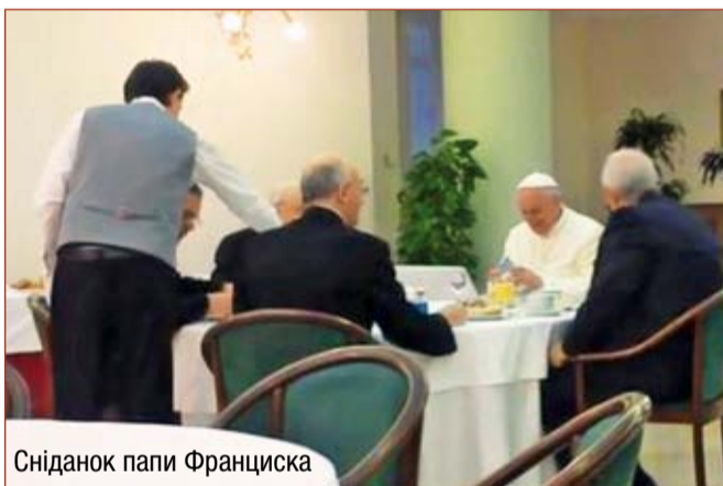
Сніданок папи Франциска