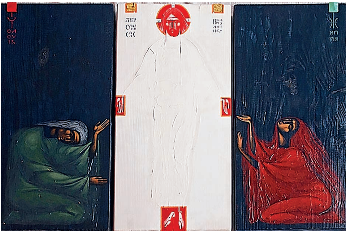
Святослав Владика, «Зішестя в ад»

У радісне свято Христового Воскресіння варто роздумати, чим є це свято для нас, а ще більше – чим є сама подія Воскресіння Господа Ісуса Христа для кожного з нас зокрема? Бо сьогодні людині, як ніколи, необхідно шукати смисл свого життя і я навіть би насмівився сказати, що більшість наших особистих і суспільних негараздів походить від того, що ми завжди поспішаємо в житті, майже ніколи не осмислюємо наших вчинків, слів чи думок.