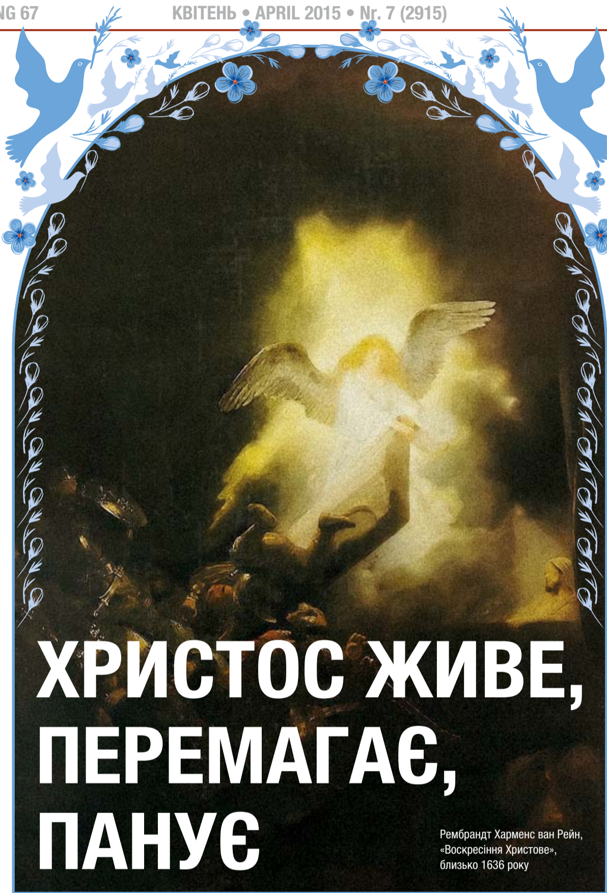
Рембрандт Харменс ван Рейн, «Воскресіння Христове», близько 1636 року

В українській класичній літературі є оповідь про Марусю Богуславку, яка була бранкою у турецькій неволі, а потім жінкою султана. Подібно як вона, у в'язниці, каралися 700 козаків-невільників. Ось як поетично про це написано. Старий козак: «Чи знаєте, браття, що сьогодні за день? Там, в Україні, сонечко сяє, а люд