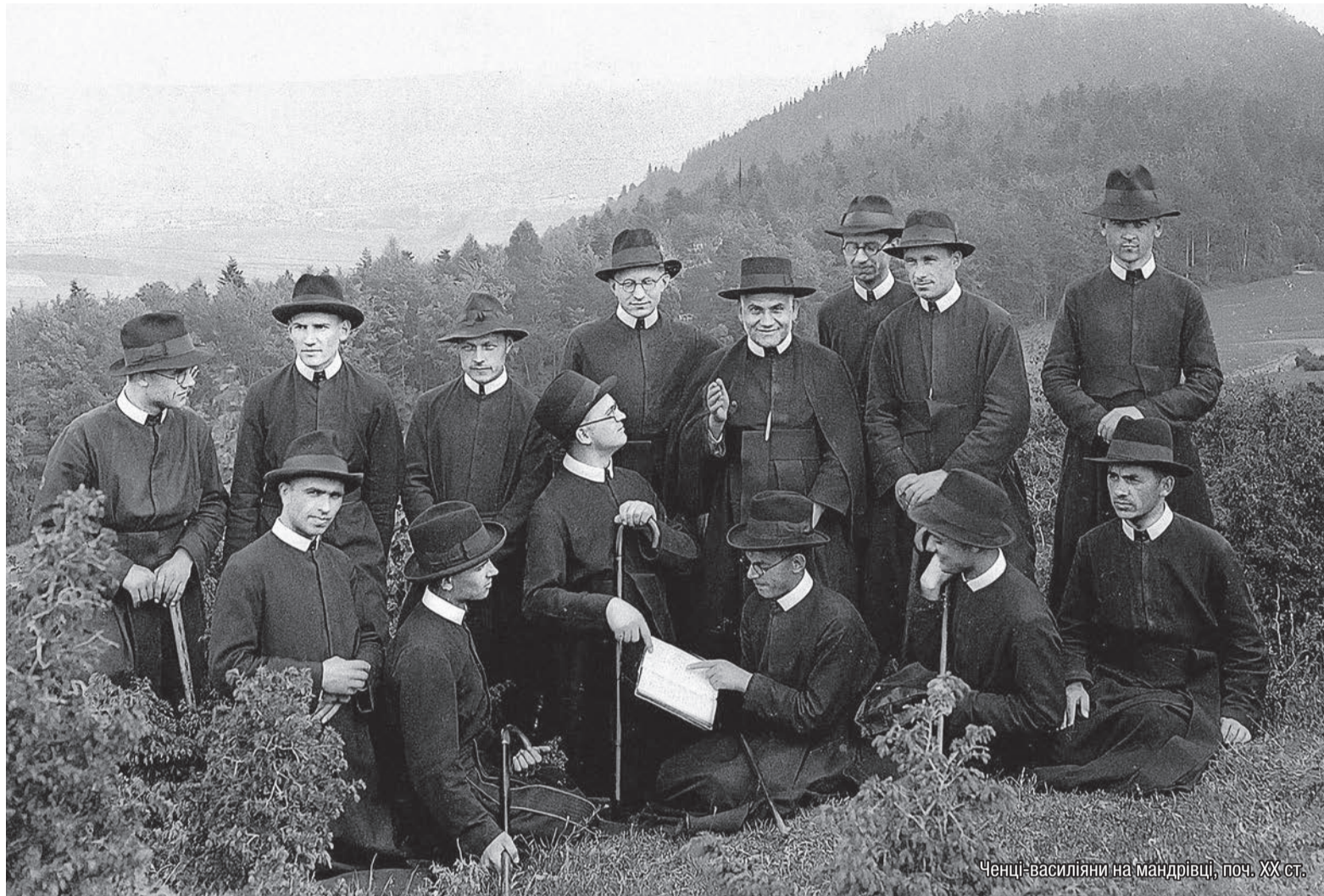
Ченці-василіяни на мандрівці, поч. XX ст.

Згідно зі статистикою від квітня 2016 року, всіх василіян у світі було 529, якщо поставити цю цифру в масштаби світу і всієї Католицької Церкви – то це крапля в морі, але якщо взяти в масштабах УГКЦ та інших Східних Церков, то це досить таки не мала цифра.