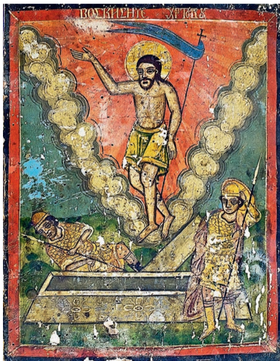
«Воскресіння Христове», болгарська уніатська ікона

Дуже подібні заяви знаходимо в двох інших євангелистів – Матея і Луки, які також наводять Ісусові слова про це пасхальне таїнство. «Отож, ми вирушаємо в Єрусалим, і Син Чоловічий буде відданий первосвященникам і книжникам, і засудять його на смерть. І видадуть його поганам,