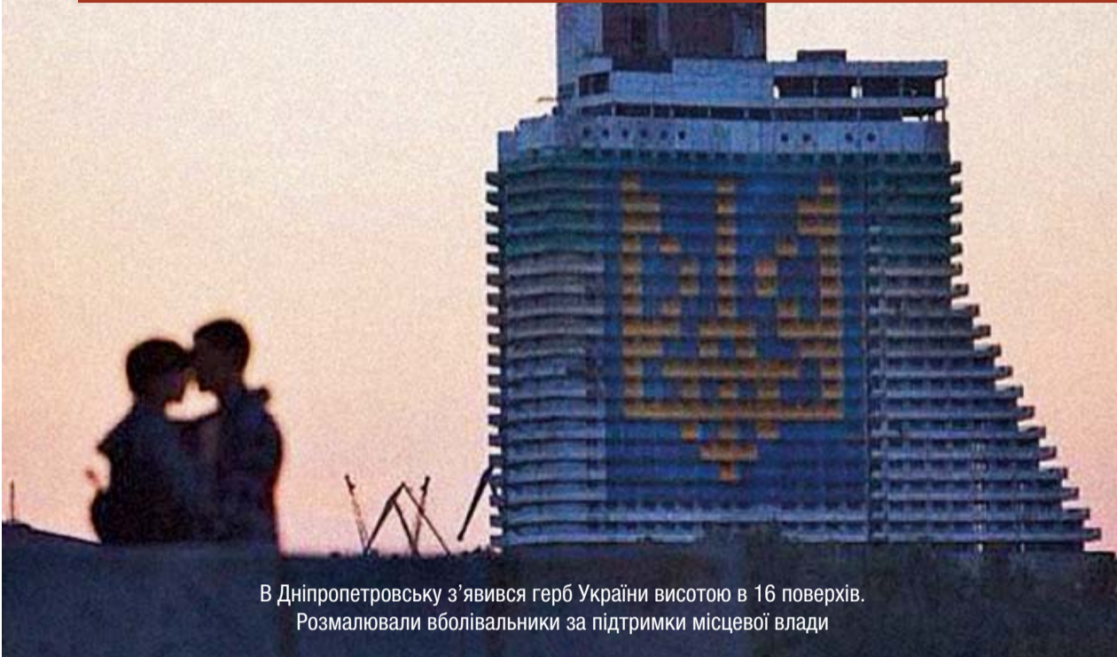
В Дніпропетровську з'явився герб України висотою в 16 поверхів. Розмалювали вболівальники за підтримки місцевої влади