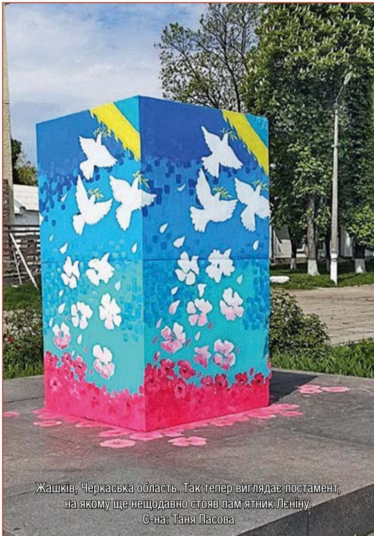
Жашків, Черкаська область. Так тепер виглядає постамент, на якому ще нещодавно стояв пам'ятник Леніну.