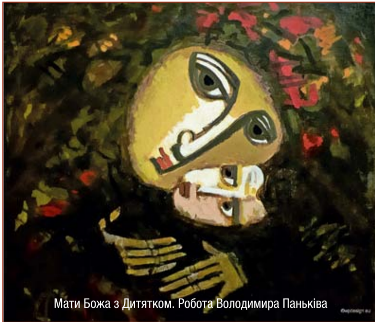
Мати Божа з Дитятком. Робота Володимира Паньківа

Замаєний буйним цвітінням, зеленню крон і трави, звеличений радісним співом птаства, зустрічає нас травень – місяць Пресвятої Богородиці, нашої небесної Матері. Роздумуючи про її життя, працю і терпіння, відкриваємо важливу життєву закономірність: без нашої згоди і копіткої, терпеливої та послідовної праці нічого не досягнемо ані ми, ані наше суспільство. Часто складається враження, що для багатьох надприродна віра – це намагання меншим коштом чи зусиллям досягнути більший результат, мовляв, Бог нас охоронить, благословить і допоможе. Тільки ж, що ми робитимемо у цій ситуації – не завжди розуміємо і передбачаємо.