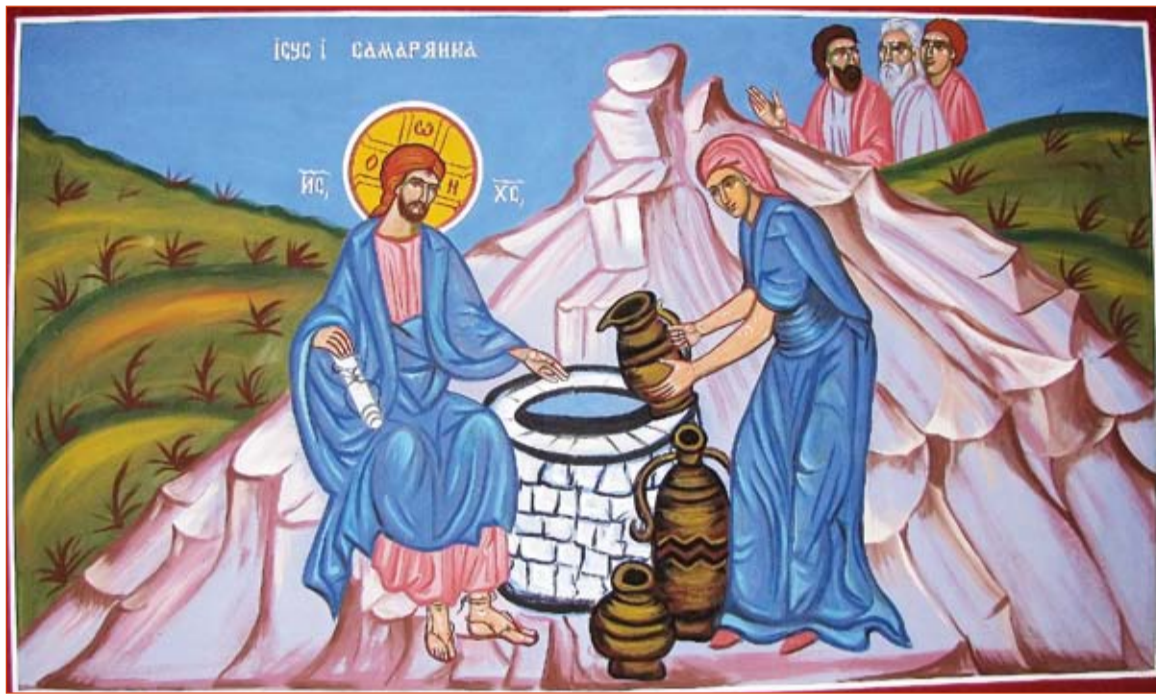
Ісус і самарянка, розпис в греко-католицькій церкві Всіх Святих в Гамбурзі, автор Данило Маруніч, монах з Сербії

ІСУС ПОЧАВ РОЗМОВЛЯТИ ІЗ САМАРЯНКОЮ ПРИ КОЛОДЯЗІ. ДЛЯ НАС В ТІМ НЕМАЄ НИЧОГО ДИВНОГО, А В ТІ ЧАСИ?