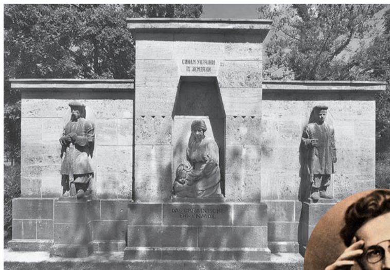
► Пам'ятник загиблим полоненим-українцям у Раштаті (Німеччина)