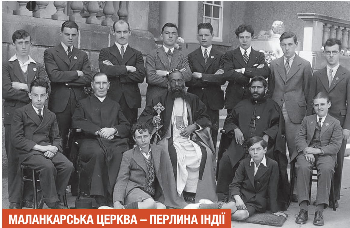
МАЛАНКАРСЬКА ЦЕРКВА – ПЕРЛИНА ІНДІЇ

Католики дуже швидко почали переформатовувати церковне життя на свій лад. Насамперед було поставлено Архієпископа Гоа і всієї Південної Індії. А в 1599 році Архієпископ Менезес скликав Собор в Удайпур, першочерговим завданням якого було виправлення всіх «помилко» в Церкві св. Томи. Легітимність таких дій була сумнівною з тієї причини, що до розгляду цих питань не було запрошено корінних християн і їх главу Архідиякона Гіваргхеса. Головним чином «виправлення помилок» було