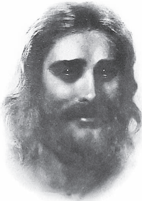
Ферн Бекхем, «Ісус милосердний»

Ісус Христос так сказав про Себе: «Я – Альфа і Омега, початок і кінець». Він і тільки Він має владу і силу повернути людину Богові. Але якою ціною? Господь повинен був зійти на землю, принизитися, уподібнившись до людини, і покійно прийняти смерть. Він мав вступити в битву з гріхом і